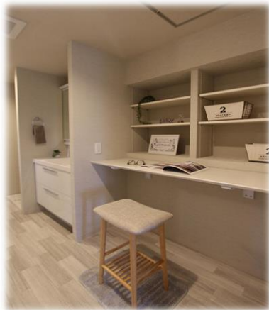
家事室としても便利な ユーティリティスペース