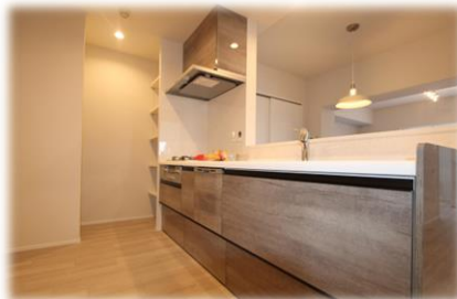
パントリーのあるキッチン