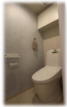
自動開閉フルオート便座