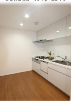
食洗機・浄水器付