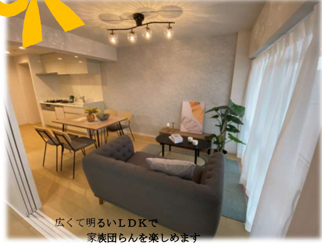
広くて明るいLDKで 家族団らんを楽しめます