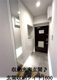
収納充実玄関♪ 玄関収納ワイド1600