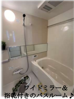
ワイドミラー& 浴乾付きのバスルーム♪