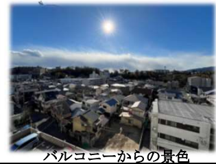
バルコニーからの景色