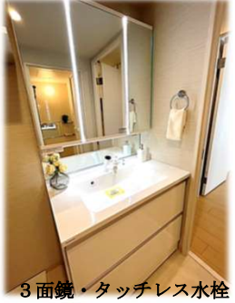
3面鏡・タッチレス水栓

※このハウジングマップは概要紹介図です。図面と現況が異なる場合は現況優先となります。