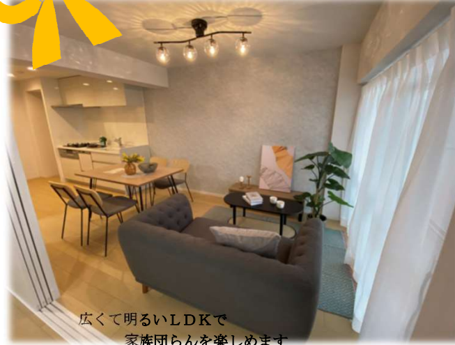
広くて明るいLDKで 家族団らんを楽しめます

～南西向きのバルコニーは眺望・陽当たり良好・3LDK～ スーパー・小中学校も近くて便利です