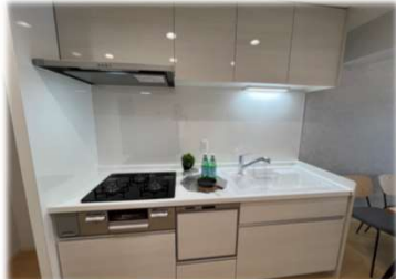
人造大理石シンクで食洗器付

フローリング張替・クロス全室張替 建具新調・キッチン(食洗機付)新調 給湯器(追だし機能付)新調 浴室(浴室乾燥機付)新調 洗面化粧台(タッチレス水栓)新調 トイレ新調・玄関収納新調 和室から洋室へ変更工事 洗濯パン新調・ダウンライト新調etc.