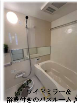
ワイドミラー& 浴乾付きのバスルーム♪