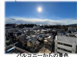
バルコニーからの景色