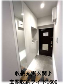
収納充実玄関♪ 玄関収納ワイド1600