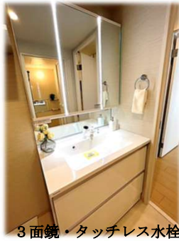
3面鏡・タッチレス水栓