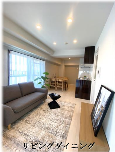
リビングダイニング