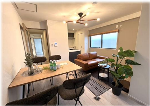
家族が集まる家の中央のLDK