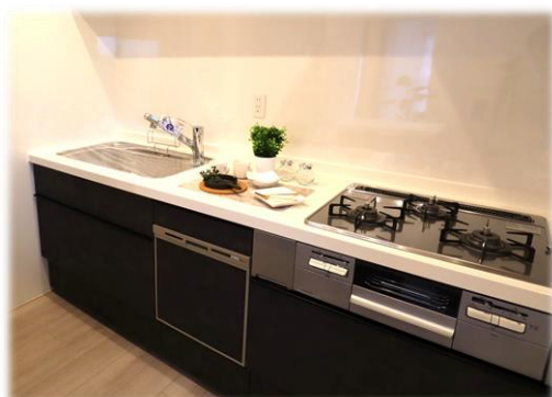
カップボード付きで収納たっぷりのキッチン