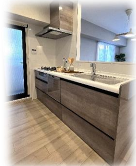
食洗器・浄水器付

全室フローリング・クロス・CF貼替、建具新調 玄関収納新調、ポスト交換、玄関人感センサー照明 キッチン新調(食洗機・浄水器付・ガラストップコンロ) 浴室新調(電気式浴室乾燥機付)、洗面所新調(洗面化粧台・洗濯パン・ハンガーパイプ新設) トイレ新調(フルオート洗浄便座付) LEDダウンライト新調、給湯器取替、分電盤交換 その他、和室→洋室に変更