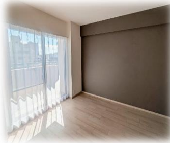
日当たり良好なお部屋☀️