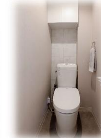
フルオート洗浄便座付