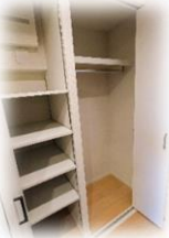
玄関横に大容量の クローゼット完備!

※このハウジングマップは概要紹介図です。図面と現況が異なる場合は現況優先となります。