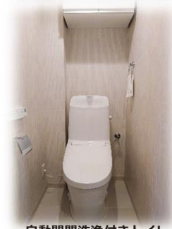
自動開閉洗浄付きトイレ