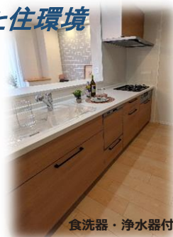
食洗器・浄水器付