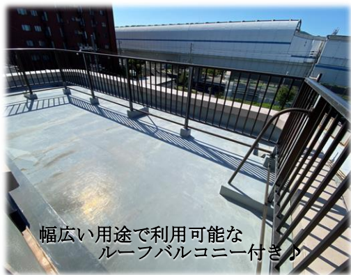
幅広い用途で利用可能なルーフバルコニー付き