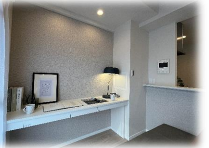
ダイニングには家事やお勉強に使いやすい デスクカウンターを設置しております。