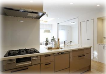
食洗器・浄水器付