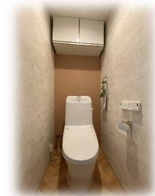
フルオート洗浄便座付き