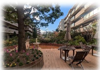
敷地内には四季折々の花咲く庭園