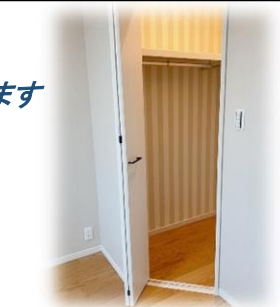
大容量ウォークインクローゼット