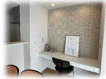
ダイニングには家事や勉強に便利なデスクカウンターを設置