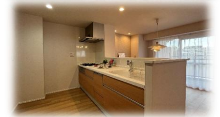
収納充実！パントリーのあるキッチン