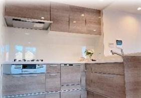
食洗器・浄水器付