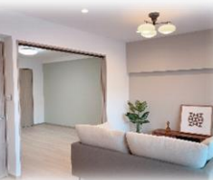
家族でくつろげるリビング