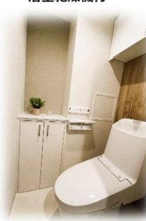
自動開閉洗浄付きトイレ