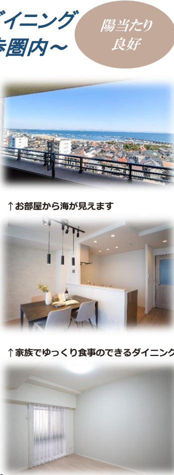
↑お部屋から海が見えます

※このハウジングマップは概要紹介図です。 図面と現況が異なる場合は現況優先となります。↑シンプルで使い勝手のいい洋室