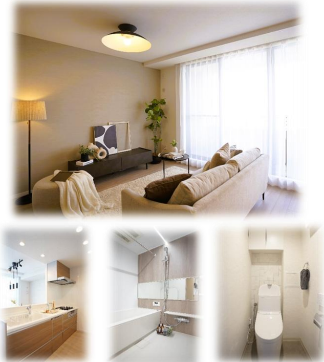
↑食洗器・浄水器付キッチン ↑浴室乾燥機付き ↑自動開閉洗浄付きトイレ

全室フローリング・クロス張替、建具新調 玄関（収納新調、人感センサー照明） キッチン新調（食洗機・浄水器付・ガラストップコンロ） 浴室新調（浴室乾燥機付）、洗面所新調（洗面化粧台・洗濯パン）、トイレ新調（フルオート洗浄便座付）、CF張替 LEDダウンライト新調、分電盤交換、給湯器新調、その他