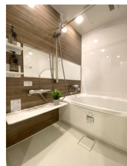
浴乾付システムバス& フルオート機能付きウォシュレット