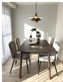
家族との会話も弾む対面キッチン