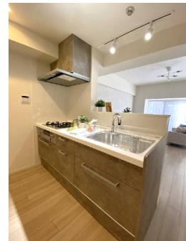
家族との会話も弾む対面キッチン