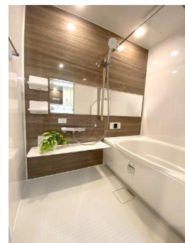
浴乾付きシステムバス& フルオート機能付きウォシュレット