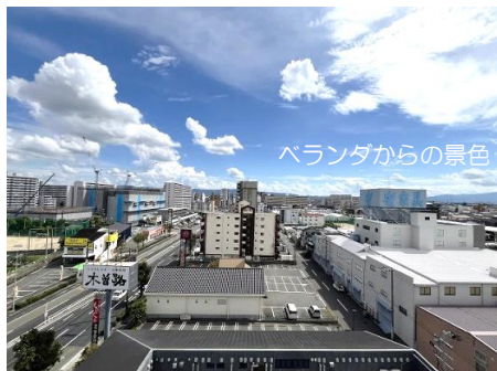
ベランダからの景色

※このハウジングマップは概要紹介図です。図面と現況が異なる場合は現況優先になります。