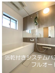
浴乾付きシステムバス＆ フルオート機能付きウォシュレット