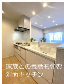
家族との会話も弾む 対面キッチン