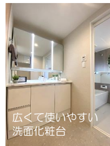
広くて使いやすい 洗面化粧台