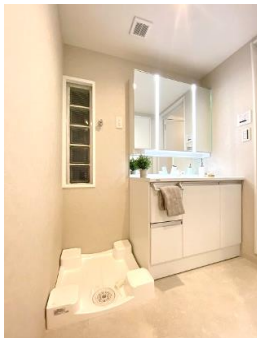
タッチレス水栓付洗面