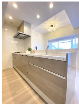
家族との会話も弾む対面キッチン