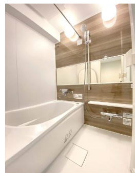
浴乾付きシステムバス