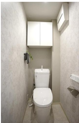
浴乾付きシステムバス& フルオート機能付きウォシュレット