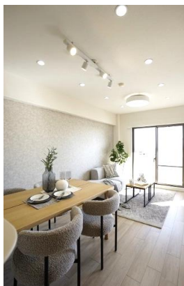
家族との会話も弾む対面キッチン