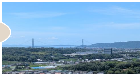
バルコニーからの景色