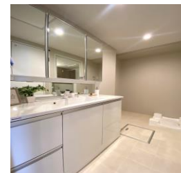
ワイド1200の洗面化粧台