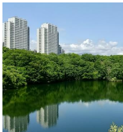
水と緑豊かな自然と触れ合える 『榎野台公園』