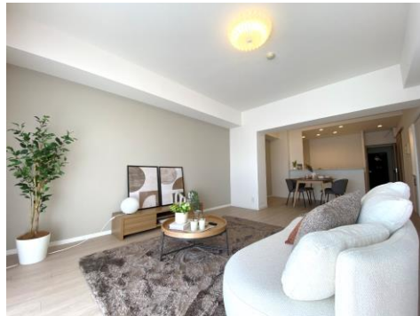
やわらかな色調でゆったりくつろげる約21帖のLDK 大きなウォークインクローゼット