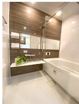
浴乾付きシステムバス& フルオート機能付きウォシュレット