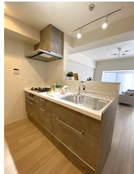
家族との会話も弾む対面キッチン