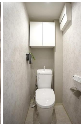
浴乾付きシステムバス& フルオート機能付きウォシュレット