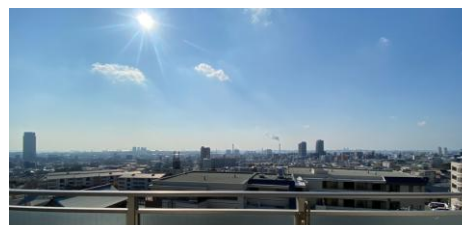
ベランダからの眺望