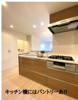
キッチン横にはパントリーあり